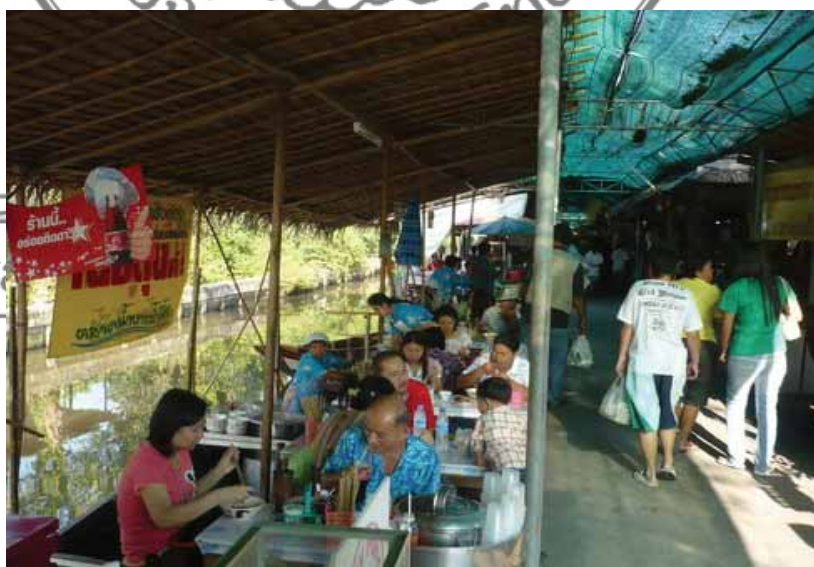
ภาพที่ 5 บริเวณที่นั่งรับประทานอาหารของตลาดน้ำบางน้ำผึ้ง