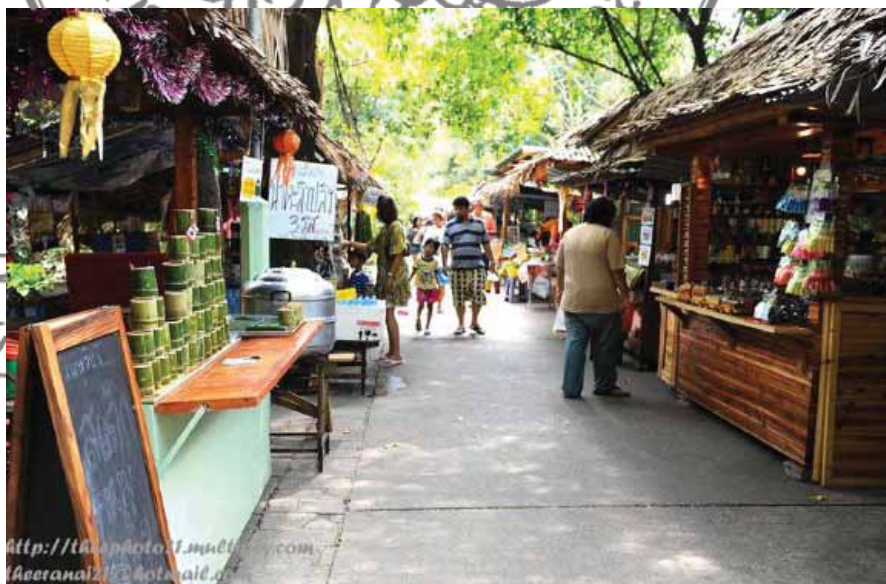
ภาพที่ 3 บริเวณทางเดินด้านในของตลาดน้ำบางน้ำผึ้ง