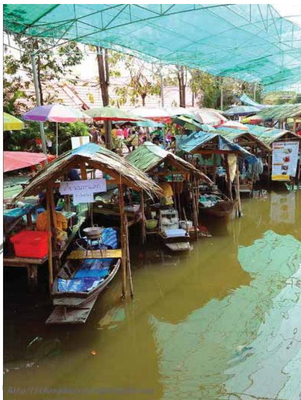
ภาพที่ 4 บริเวณที่ขายสินค้าของตลาดน้ำบางน้ำผึ้ง