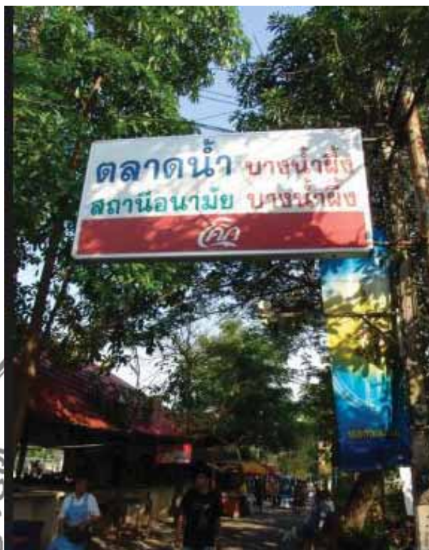
ภาพที่ 2 บริเวณทางเข้าของตลาดน้ำบางน้ำผึ้ง